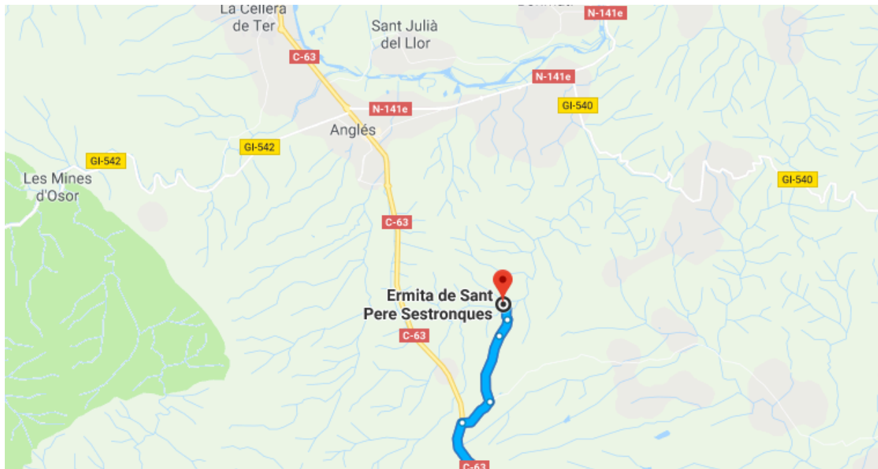
Figura 2. Plànol de situació.

https://goo.gl/maps/t6QhcX29snG2 Ermita de Sant Pere Sestronques, Anglès (Girona)